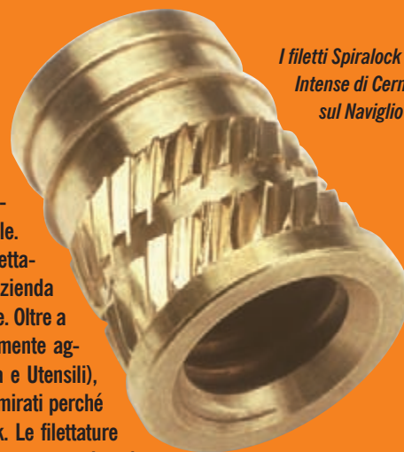
I filetti Spiralock della Intense di Cernusco sul Naviglio (MI).

Segnare 785 cartolina servizio informazioni